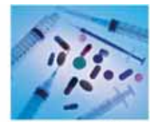
次世代型医療材料

設計した分子（粉末）を水に溶かすと、、、ナノひも構造から、ナノわらじ構造へ自動的に網上がる