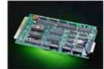
次世代型集積回路