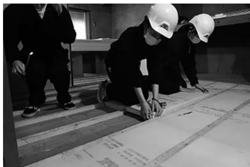
写真9 断熱材施工の様子

の無垢フローリングを張る仕様とした。スタイロフォームは転ばし根太(30mm×40mm)の間に敷き詰める為、サイズに合わせてカッターで切断し、はめ込んでいく作業を行った。スタイロフォームはカッターでも切りやすく、学生でも容易に施工が可能であった。