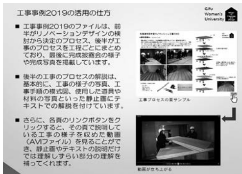
写真20 工事事例2019の構成イメージ

家リノベーション事業推進会議の設計事務所の方々や興味を持っていただいた建築業界の方々などに配布するとともに、各務原市を通じて希望する市民等に広く配布することとなっている。