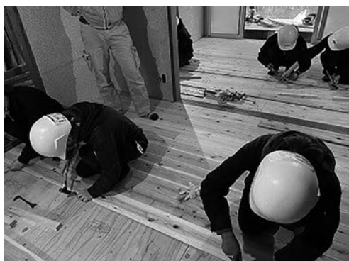
写真11 床下地施工の様子

合板の上に無垢の杉フローリング(厚さ15mm)を張っていった。部屋のサイズを計測し、本実加工がされたフローリングの長手方向を、丸鋸で切断し、一度サイズが合うかどうかを確認した後、接着剤を少量つけ、雄実、雌実がきちんと合うようにはめ込み、フロア釘を実の部分に45~60度の角度で打ち込んでいった。実際にやってみると、板を傷つけないようにポンチを釘の頭に当て、金槌で打ち込むことに苦戦した。床下地工事と同様、後半は職人さんが使用するエアードリル機をお借りした。一般の方がDIYでリフォームを行うことを想定すると、プロの道具はなかなか持っていないため、このようにいくつかの施工パターンを教えていただくことは選択肢が広がり、DIYにチャレンジしやすくなると感じた。