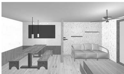
写真4 ナチュラルスタイルのLDイメージパース

1つ目のナチュラルスタイルは、耐力壁であるOSBボードを生かし、仕上げはせず敢えてむき出しとした壁面と、パステルカラーに塗装した壁面をバランス良く配置した。家具の材料もOSBボードをメインに使用することで、部屋全体の調和を図り、明るくナチュラルな空間となる提案とした。