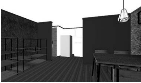
写真5 モダンスタイルのLDイメージパース