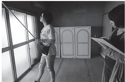
写真1 現地調査の様子

建物の状態として、外壁のトタンの劣化がかなり進んでおり、このままでは借り主を見つけるのは難しいと感じる状態であった。内部も、和室の押入れ部分の床が一部欠損しており、畳もかなり傷んだ状態であった。また主な間仕切り壁の仕上げが繊維壁で、変色が進み、一部剥がれているところもあった。浴室も狭く、またキッチンの流し台も小さく、扉の破損があり、クリーニングをしてもこのまま使用するのには難しいと思われた。トイレは汲み取り式であったため、最初から水洗ト