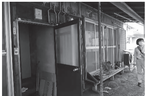
写真2 南側玄関口外観の様子