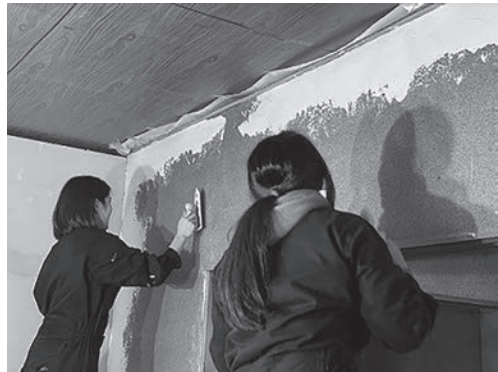
写真14 左官工事の様子