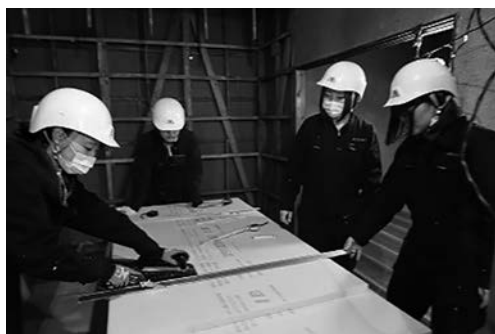
写真8 断熱材カットの様子