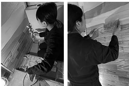
写真16、17 板張りの様子 (文責：森田実沙)

玄関ホールの壁の一部をアクセントに木板張りとした。卒業生が働く企業から提供していただいた、圧密加工されたw210×h90×t3mmの杉板のパネルを壁の割付を考え、下から順番に貼った。重ね代を15mm設け重なる部分にフィニッシュネイルで板を留め、うろこ張りのような仕上げとした。壁の両端や窓枠、建具枠との取り合い部分はサイズに合わせてカットし、細かな加工が難しかったが、割と容易に施工することができた。