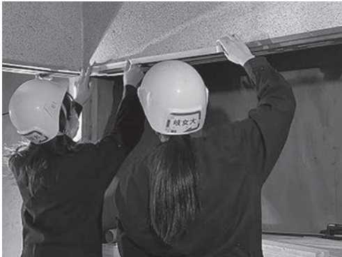
写真12 建具枠養生の様子

一部の部屋は現在の繊維壁の上に直接塗り壁材を施工していく方法を採用した。その為、シーラー処理を行った。まずは塗布するにあたり、床や建具枠等を汚さないように養生を行い、ローラーや刷毛を使いカチオンシーラーを塗っていく。シーラーを塗ることで、塗り壁をするにあたって下地を補強し、上に塗る塗り壁材の吸い込みを抑え、密着性を良くする。このような作業は完成時には目には見えてこないため、どのような役目を果たすのか作業の必要性を理解し、実践できることは学生にとって大きな学びとなった。