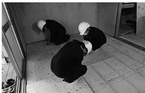
写真10 床下地施工の様子

地を施工した。合板は職人さん指導のもと、部屋のサイズに合わせて丸ノコで切断した。釘やビスが転ばし根太の部分に留まるように、根太が入っているところに目印の墨を打ち、金槌を使いN釘で1本1本留めていった。後半は職人さんが使用するエアードリル機をお借りし、作業の効率化を図った。