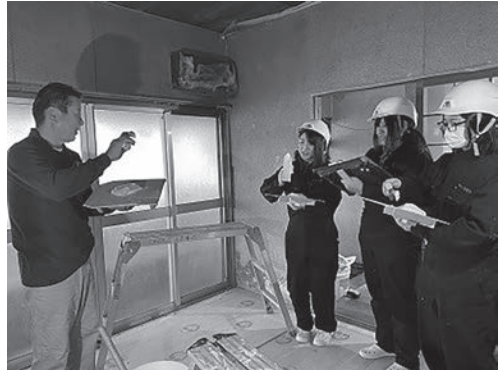
写真13 職人さんから左官指導の様子

シーラー処理を施した繊維壁の上に塗り壁材（オンザウォール）を直接塗っていった。外周面の一部は断熱改修を行ったため、スタイロフォームの上に塗る仕上げとした。コテとコテ板を使用し、壁の隅部分から順に塗っていったが、職人さんのように仕上げることは難しく、プロの技術のすばらしさを体感した。しかし、塗りムラがあっても“味”のある雰囲気になり、性能面では問題ない為、このような仕上げはDIY向きだと感じた。