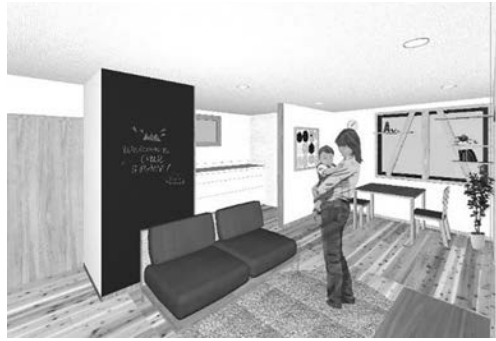
写真7 LDイメージパース