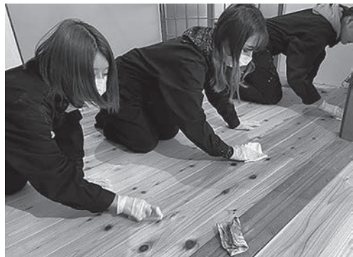
写真15 床塗装の様子

無垢の杉フローリングに木材保護塗料であるバトンの塗布を行った。塗布するにあたり、養生をすべて撤去し、清掃を行い、接着剤や塗壁材の汚れが少しあったため、ペーパー掛けも行った。コテ刷毛やスポンジに塗料をしみ込ませ、フローリングの目に沿って塗布し