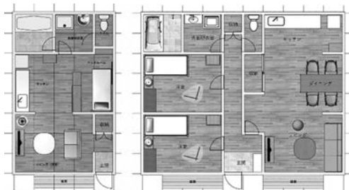
写真3 プランA(左), プランB(右)

プランBは、夫婦と子ども一人または二人暮らし（シェアハウス）を想定し、二戸を一戸にまとめた2LDK案とした。広々としたLDKと2つの個室を設け、夫婦で暮らす場合は、個室の1室を寝室、もう1室を趣味