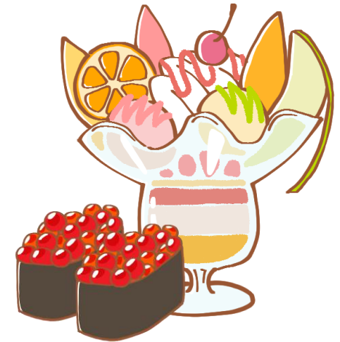
組み合わせて作る